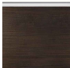
ソフトウォールナット柄